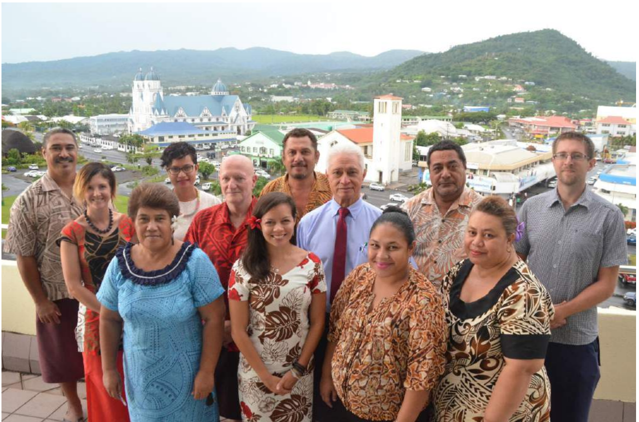
AUFAIGALUEGA A LE OFISA O LE KOMESINA O SULUFAIGA MA AIA TATAU, IANUARI 2015