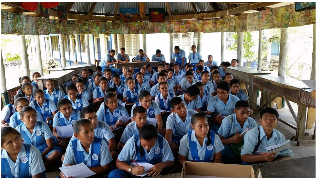
FA'ATINO LE PEPA FESILI I LE KOLISI O ASAU, 12 MATI, 2015