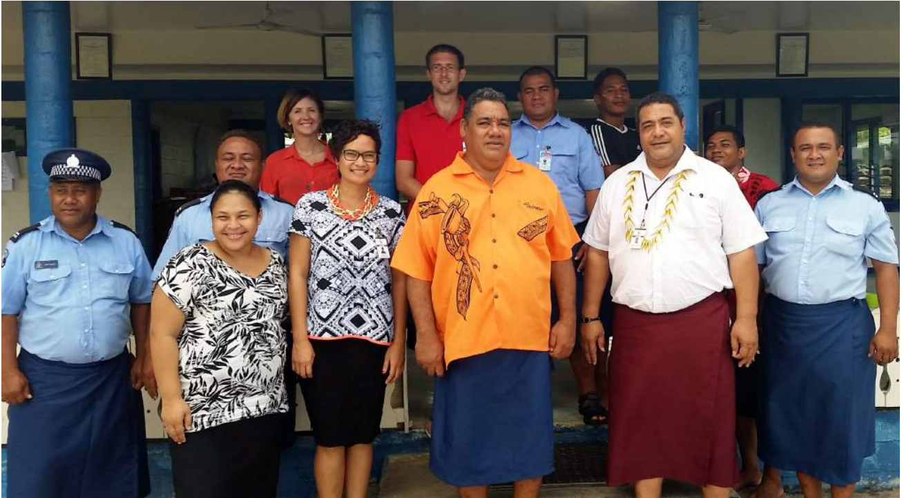
NISI O LE AUFAIGALUEGA A LE OFISA MO AIA TATAU MA NISI O LE AUFAIGALUEGA A LE OFISA O FALEPUIPUI I SE ASIASIGA I LE FALEPUIPUI I OLOAMANU, IANUARI 2015