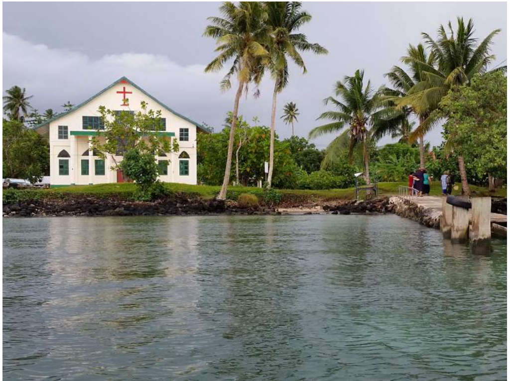
EKALESIA METOTISI I LE MOTU O MANONO