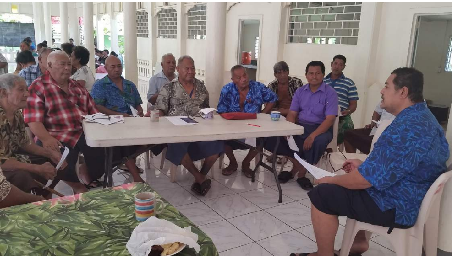
FA'ATALATALANOAGA MA MATAI MA TAULELE'A O LE AFIOAGA O MOATAA, 14 MATI, 2015