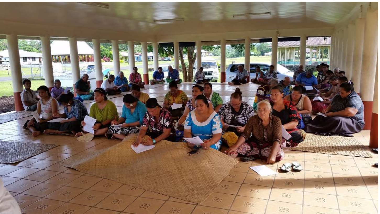
FA'ATALATALANOAGA MA LE AFIOAGA O IVA, SAVAII, 11 MATI 2015