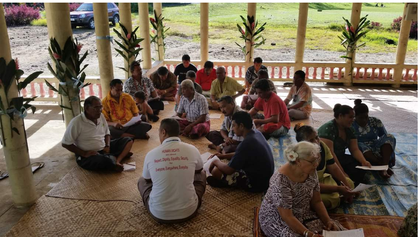
FA'ATALATALANOAGA MA LE VAEGA O ALII I LE AFIOAGA O FALEALUPO, SAVAII, 13 MATI 2015