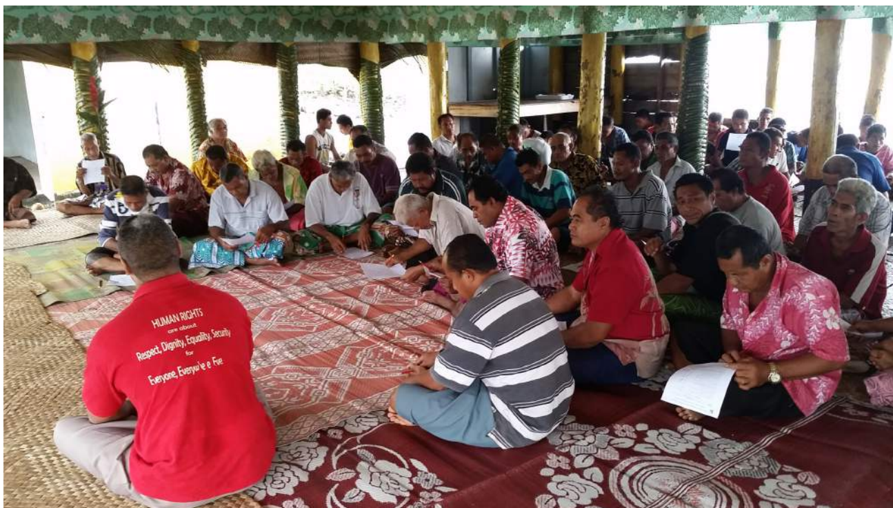
FA'ATALATALANOAGA MA MATAI MA TAULELE'A O LE AFIOAGA O SASINA, SAVAII 12 MATI 2014

O le talamoni, na lāgā i le Su'esu'ega ma feutaga'iga ma fefa'asoaa'iga ma nu'u ma afio'aga popōlega olo'o iai e uiga i le fete'ena'i o fa'ai'uga a fonu a nu'u ma afio'aga ma aiā tatau a tagata ta'ito'atasi i totonu o nu'u. O nei popōlega e aofia ai matā'upu tetele e pei o le fa'atūina o lotu fou i totonu o nu'u ma le fa'atūla'i ese ma le nu'u, ma fa'amatalaga lautele e fa'atatau i le fitā ma le mamafa o tulafono a nu'u. 31 O le Fa'asāmoa , e tutusa lelei le iloa e le tagata o ana aiā tatau ma lona mana'o e amana'iaina, e pei fo'i o isi tagata. Peita'i, ua ia iloa lelei fo'i ma talia le nafa ma le pule a le nu'u olo'o avea ai le matai o lona 'āiga o se sui. 32 O lea lā e matuā tāua ai le amana'ia o aiā tatau a tagata ta'ito'atasi e pei fo'i ona taga'i i aiā tatau faitele i le fa'atinoga o pulega a Ali'i ma Faipule , ma fa'apea ona fa'asagasagatonu ai a latou fa'ai'uga. E leai se agaga o le Ofisa e fa'aitiitia le tulaga o le pule mamalu a Ali'i ma Faipule . Peita'i, e iai le talitonuga, 'āfai e puipuia tagata ta'ito'atasi mai pulega lē tonu pe lē talafeagai po o ni isi itū e lē tusa mafua'aga, ua fa'apea fo'i ona puipuia tagata uma o le atunu'u.