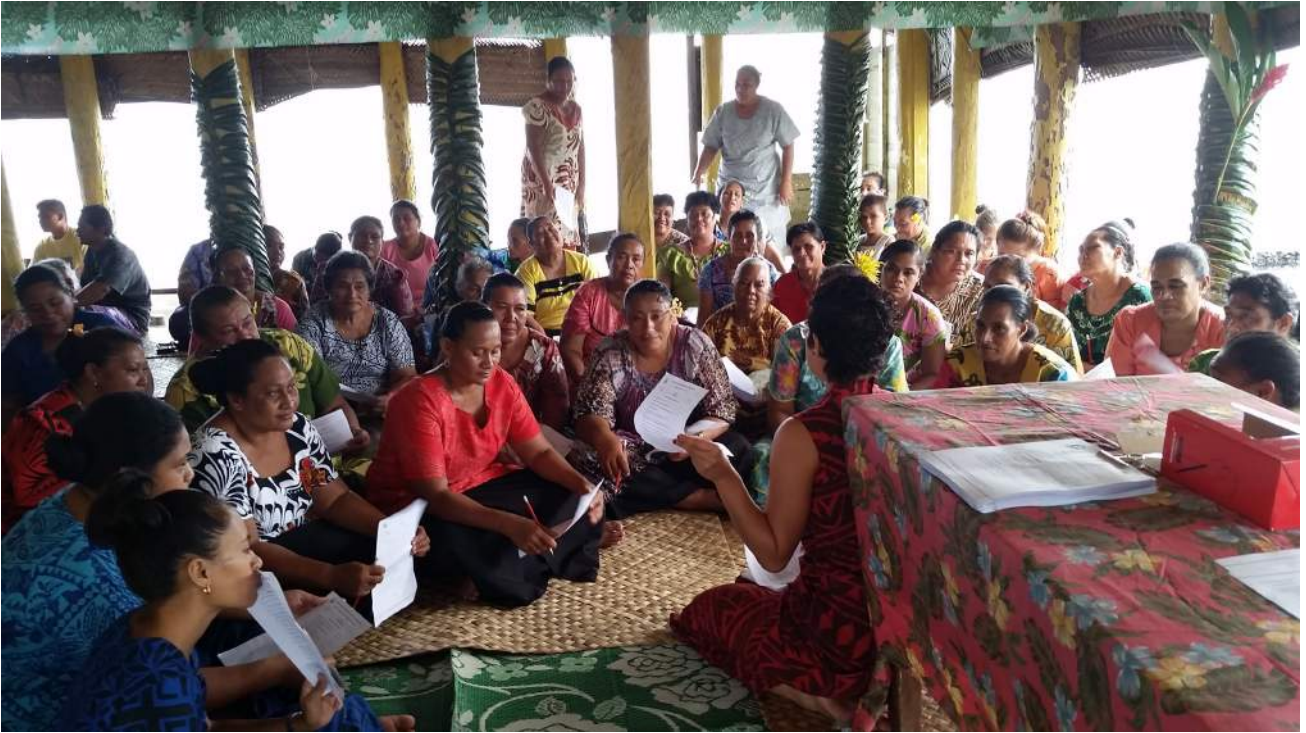
FA'ATALATALANOAGA MA TINA O LE AFIOAGA O SASINA, SAVAI'I 12 MATI 2015