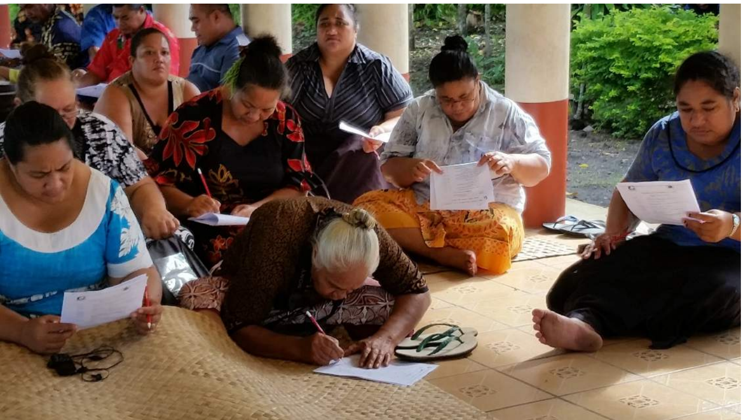
FA'ATALATALANOAGA MA LE VAEGA O TINA I LE AFIOAGA O IVA, SAVAII, 11 MATI 2015