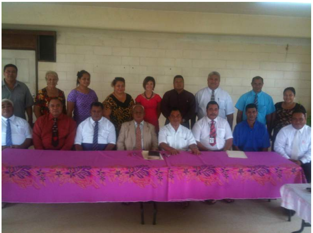
FA'ATALATALANOAGA A LE OFISA O AIA TATAU MA LE KOMITI O EKALESIA SO'OFAATASI 12 MATI 2015